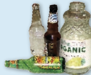
Glass bottles & jars Botellas y jarras de vidrio