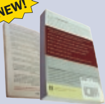
Paperback books libros de tapa blanda