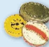
Loose metal jar lids & steel bottle caps Tapas de metal para frascos