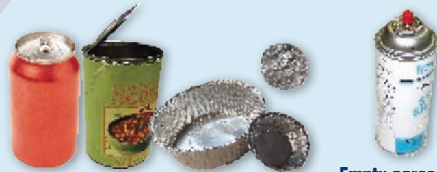
Cans (do not crush), clean, balled aluminum foil & pie pans Latas (no aplastarlas), papel de aluminio limpio en un globo