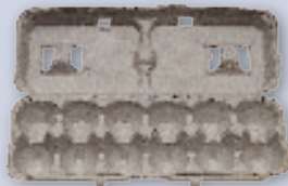
Paper egg cartons Envases de cartón para huevos