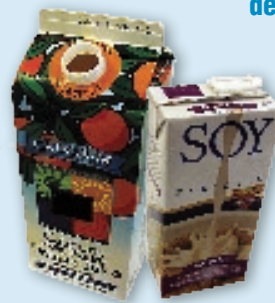
Milk cartons & drink boxes (no foil pouches) Cajas y envases de papel de leche y jugo (no bolsas hechas de aluminio)