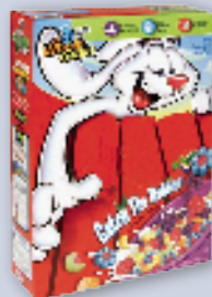
Paperboard boxes Cajas de papel cartón