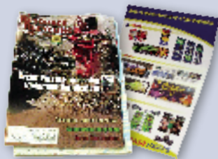
Magazines & brochures Revistas y folletos