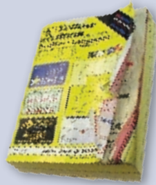
Phonebooks Guías de teléfono