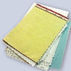
White or pastel office paper Papel de oficina color pastel o blanco