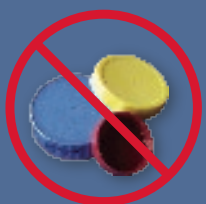
plastic caps or lids