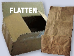
Corrugated cardboard & brown paper bags Cartón corrugado y bolsas de papel marrón