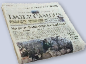
Newspapers & inserts Periódicos y propaganda insertada