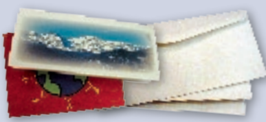
Opened mail & greeting cards Correo abierto y tarjetas de felicitación