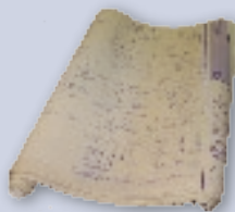
Blueprints Planos de proyecto