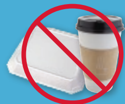
Styrofoam® or paper takeout containers or cups